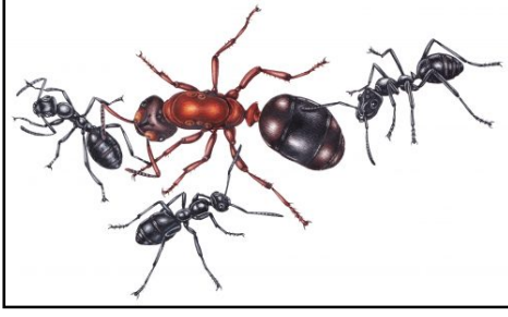
चित्र 1 - राणी मुंगी आणि कामगार मुंग्या

मुंग्या झोपतात का? होय, त्या झोपतात. साधारणपणे 12 तासात आठ मिनीटे झोपतात. राणी मुंगी मात्र बरीच झोपते.