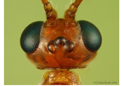
डोळ्यांचा मोठा केलेला फोटो

सर्वसाधारणपणे मुंगीचे शरीर तीन भागात असते (चित्र 2). ते म्हणजे डोके, धड (Thorax), पोट (Abdomen). डोक्याकडील भागावर डोळे, अँटीना व छोट्या मिशा (Mandible) असतात. ह्या मिशा पाने कापण्यासाठी, भक्ष पकडण्यासाठी किंवा संरक्षणासाठीही उपयोगाला येतात.